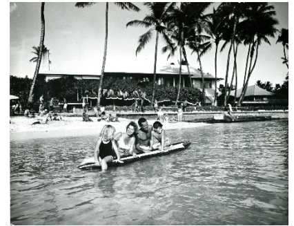
ビーチハウス(1950 年撮影)

ハレクラニのルーツは 1881 年、ルワーズ伯爵夫妻が漁師達をもてなしたビーチハウスに遡ります。心のもったもてなしを受けた漁師達がこのビーチハウスをハワイ語で「ハレクラニ」、つまり『天国にふさわしい館』と呼んだところからこの名がつけられました。1917 年にノースショアのホテル経営者であったキンバル夫妻がこのビーチハウスを取得し、ホテルを開業しました。