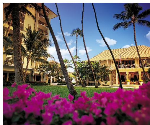
現在のメインビルディング