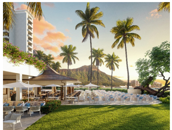
「House Without A Key」リニューアル後イメージ