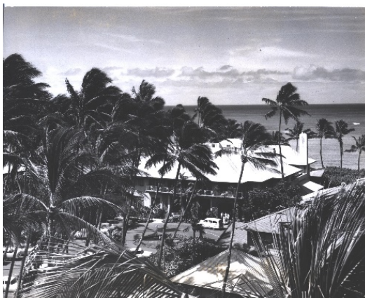
1932 年竣工のメインビルディング(1950 年撮影)

5 棟の建物は、市街地に背を向け、海に向かってアルファベットの「E」の字型に配置されました。宿泊客にワイキキビーチの眺望を楽しんでいただくために、ほぼ全ての客室から、プールや中庭越しにハワイの青い海が眺められる設計となっています。