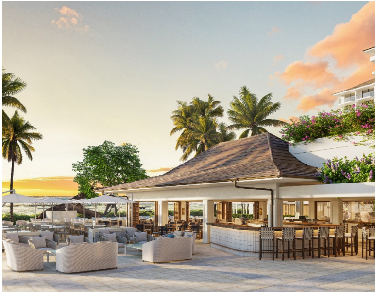
「House Without A Key」リニューアル後イメージ 新設の屋外バー

そして今般、建物の主要設備類の更新や基本性能の維持向上、パブリックスペースやスイートを含むすべての客室の家具、什器類の刷新等大規模なリニューアルを行い、新たなハレクラニへと生まれ変わりました。